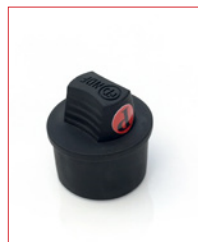
XLR-Cap (for female) Stk. € 22,- / 10 Stk. € 180,-