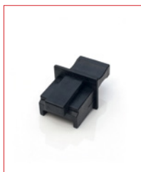
RJ45-Plug (Ethernet) Stk. € 16,- / 10 Stk. € 130,-