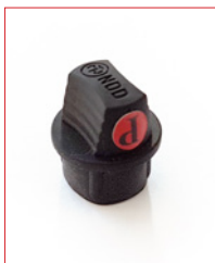
DIN-Plug Stk. € 22,- / 10 Stk. € 180,-