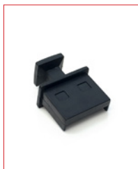
USB-A-Plug Stk. € 16,- / 10 Stk. € 130,-