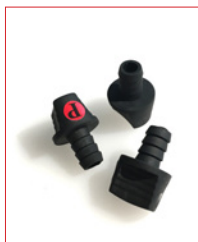
6.35 mm Klinke-Plug Stk. € 22,- / 10 Stk. € 180,-