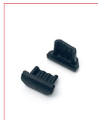
USB-Micro-Plug Stk. € 16,- / 10 Stk. € 130,-