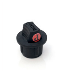
XLR-Cap (for male) Stk. € 22,- / 10 Stk. € 180,-