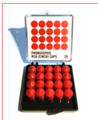
RCA (Cinch) Caps Stk. € 8,50 / 20 Stk. € 135,-