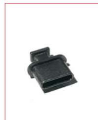
USB-C-Plug Stk. € 16,- / 10 Stk. € 130,-