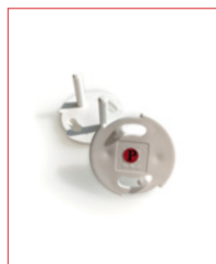
Power-Cap (Steckdose) Stk. € 22,- / 10 Stk. € 180,-

Alle Preise Netto zzgl. MwSt. Irrtum und Änderungen vorbehalten. Stand: Januar 2024. Alle vorherigen Preislisten verlieren hiermit ihre Gültigkeit. Bei einem Bestellwert unter EUR 250,- wird eine Versand-/Handlingspauschale berechnet.