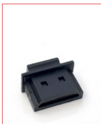
HDMI-Plug Stk. € 16,- / 10 Stk. € 130,-