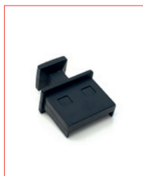
USB-A-Plug Stk. € 13,- / 10 Stk. € 100,-