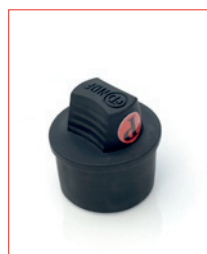
XLR-Cap (for female) Stk. € 18,- / 10 Stk. € 150,-