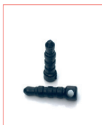
3,5 mm Klinke-Plug Stk. € 13,- / 10 Stk. € 100,-