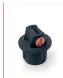
XLR-Cap (for male) Stk. € 18,- / 10 Stk. € 150,-