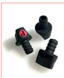
6,35 mm Klinke-Plug Stk. € 18,- / 10 Stk. € 150,-