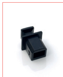
USB-B-Plug Stk. € 13,- / 10 Stk. € 100,-