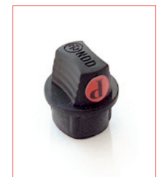
DIN-Plug Stk. € 18,- / 10 Stk. € 150,-