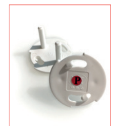
Power-Cap (Steckdose) Stk. € 18,- / 10 Stk. € 150,-