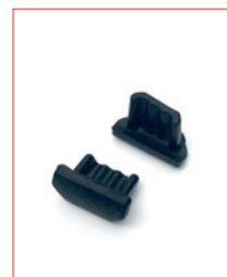
USB-Micro-Plug Stk. € 13,- / 10 Stk. € 100,-