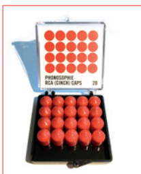
RCA (Ginch) Caps Stk. € 7,- / 20 Stk. € 100,-